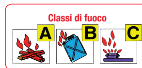
ESTINTORE A POLVERE DA KG 9 PMB9EN CLASSI DI FUOCO 55A-233BC

Serbatoio di grande capienza: 8,20 litri permette una maggiore carica di azoto per una scarica ottimale