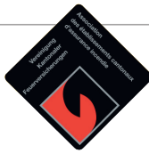
ESTINTORE A POLVERE DA KG 1 PMB1EN CLASSI DI FUOCO 8A-34BC